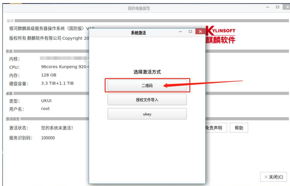
图 2-1 系统激活客户端主界面

在 UKUI 桌面环境下，在“我的电脑”->属性，点击激活，可以在二维码激活、授权文件导入、ukey 激活等三种激活方式中通过二维码进行激活，选择系统激活客户端主界面如下图：