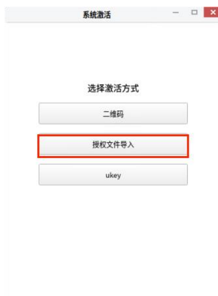
图 2-9 系统激活客户端主界面

在 UKUI 桌面环境下，在“我的电脑”->属性，点击激活，可以在系统激活客户端主界面中从二维码激活、授权文件导入、ukey 激活三种激活方式中选择授权文件导入激活方式，。