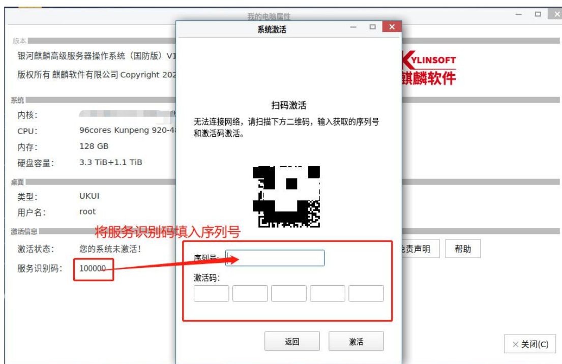
图 2-3 未联网状态激活界面

将激活码和服务识别码填入如下图未联网状态激活界面中的对应输入框进行激活操作，其中序列号为服务识别码：