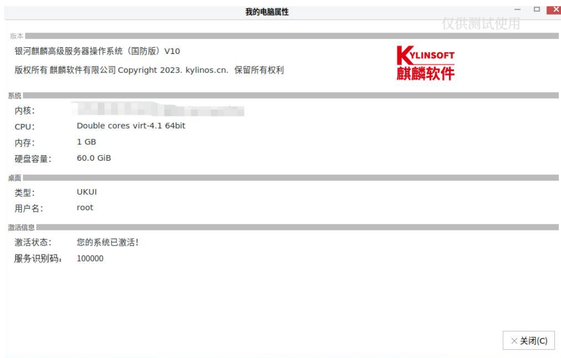
图 1-5 已激活状态界面