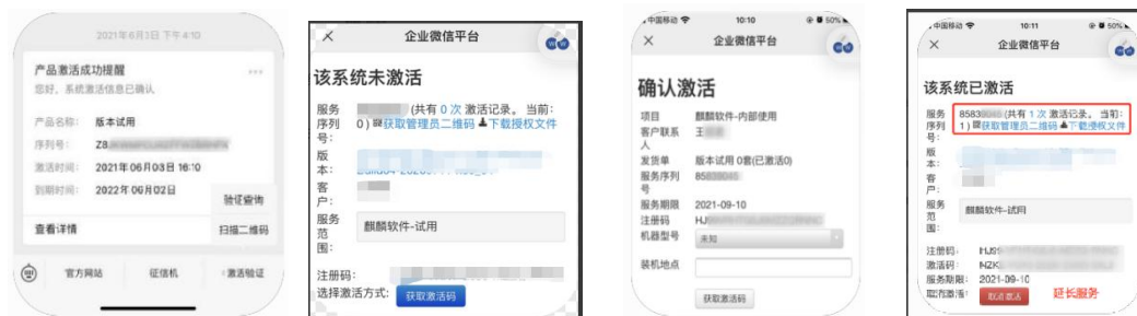
图 2-2 企业微信平台

将激活码和服务识别码填入如下图未联网状态激活界面中的对应输入框进行激活操作，其中序列号为服务识别码：