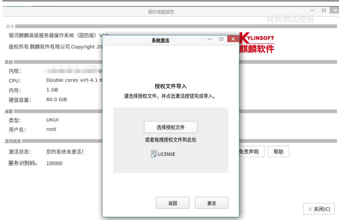
图 2-12 授权文件导入界面