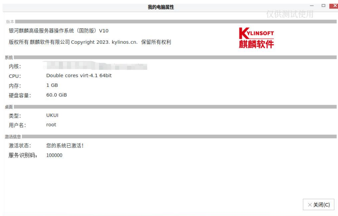
图 2-4 系统激活状态

激活成功后，重新进入“我的电脑属性”界面，该界面激活状态会显示“您的系统已激活！”