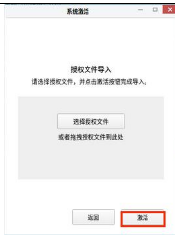
图 2-10 授权文件导入界面

通过点击“选择授权文件”按钮或拖拽授权文件至界面两种方式的任意一种，完成授权文件选择，如图，选择 LICENSE 文件。