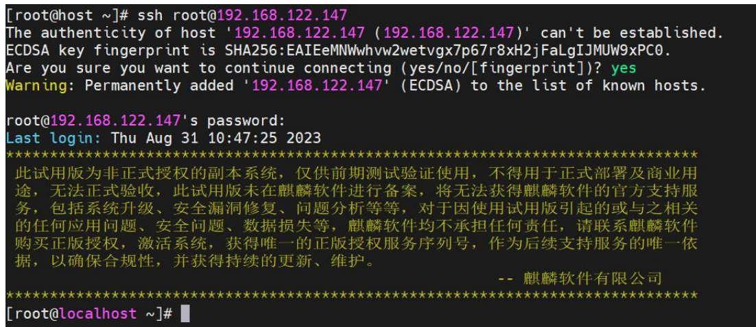
图 1-3 远程 ssh 登录提示界面