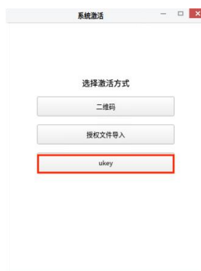
图 2-8 系统激活客户端主界面

若为 ukey 激活，先插入 ukey，在 UKUI 桌面环境下，在“我的电脑”->属性，点击激活，可以在二维码激活、授权文件导入、ukey 激活等激活方式中通过 ukey 进行激活，选择系统激活客户端主界面如下图：