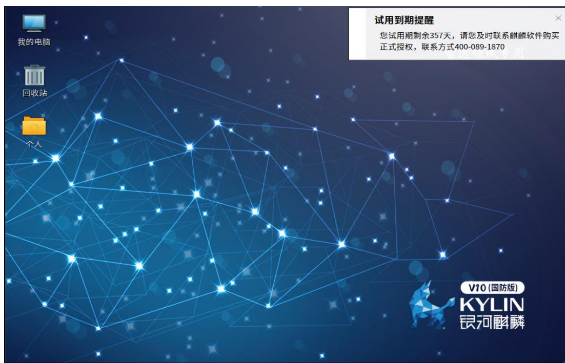
图 1-2 右上角弹窗界面提醒界面