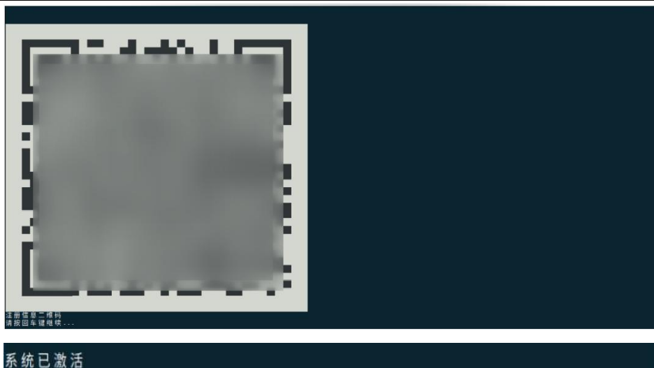
图 2-6 终端激活操作

系统激活后，可以在终端通过 kylin_activation_check 查看激活状态：