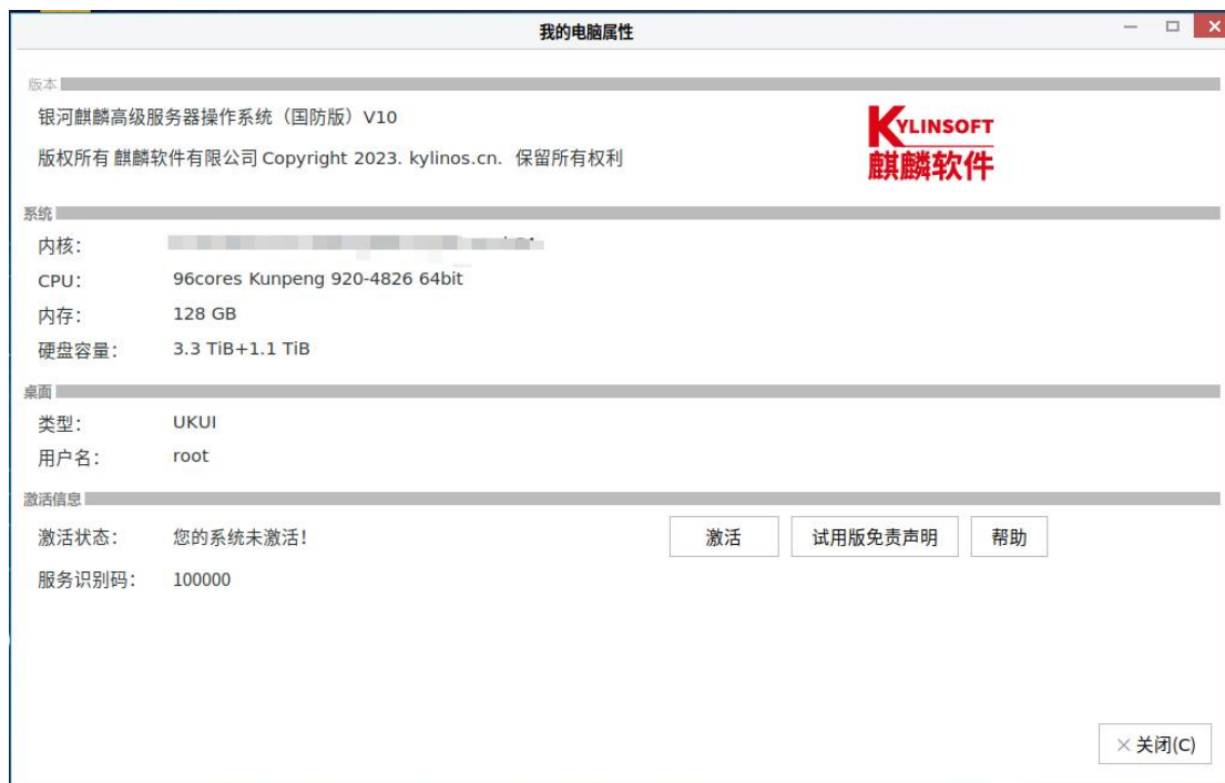
图 1-4 系统未激活状态界面