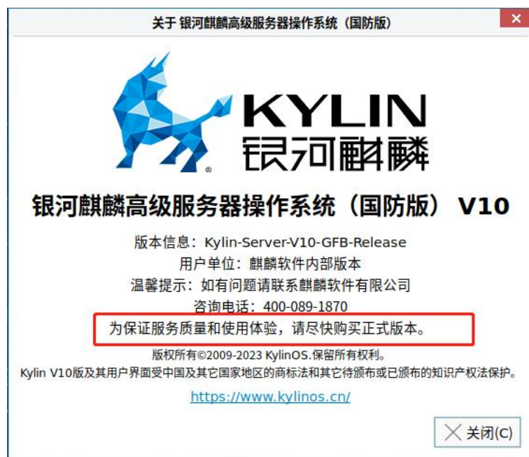
图 1-1 关于银河麒麟提示界面

若已过试用期未激活系统，则会在关于银河麒麟界面中提醒用户：为保证服务质量和用户体验，请尽快购买正式版本。