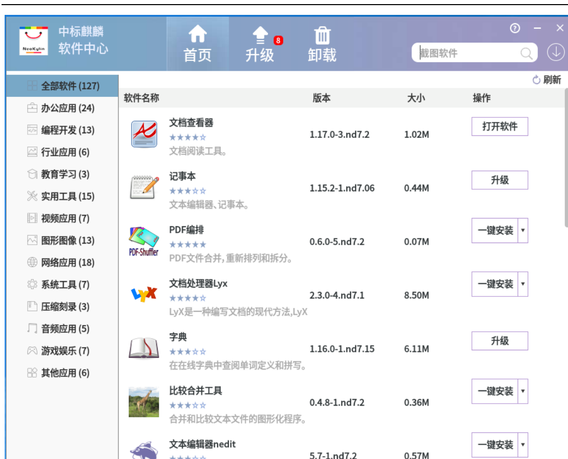
图 2-1 中标麒麟软件中心首页