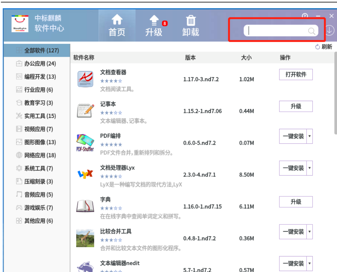
图 2-2 软件搜索