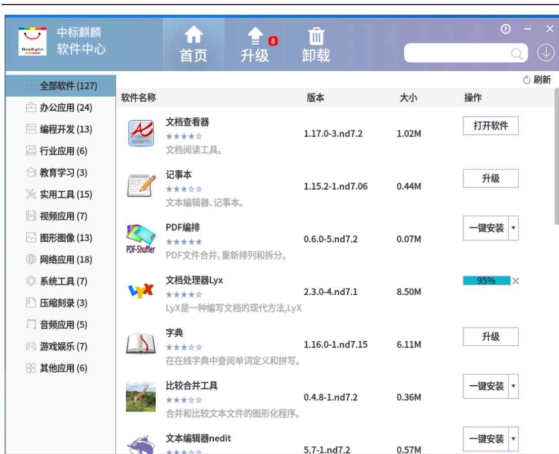
图 2-3 软件下载